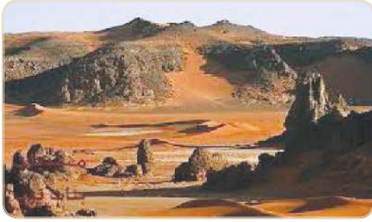
هضبة الصحراء الإفريقية الكبرى

تمتاز قارة إفريقيا عن باقي القارات بأن أرضها يسودها الطابع الهضبي، ومن مظاهر السطح فيها: